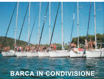
BARCA IN CONDIVISIONE