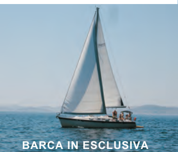
BARCA IN ESCLUSIVA